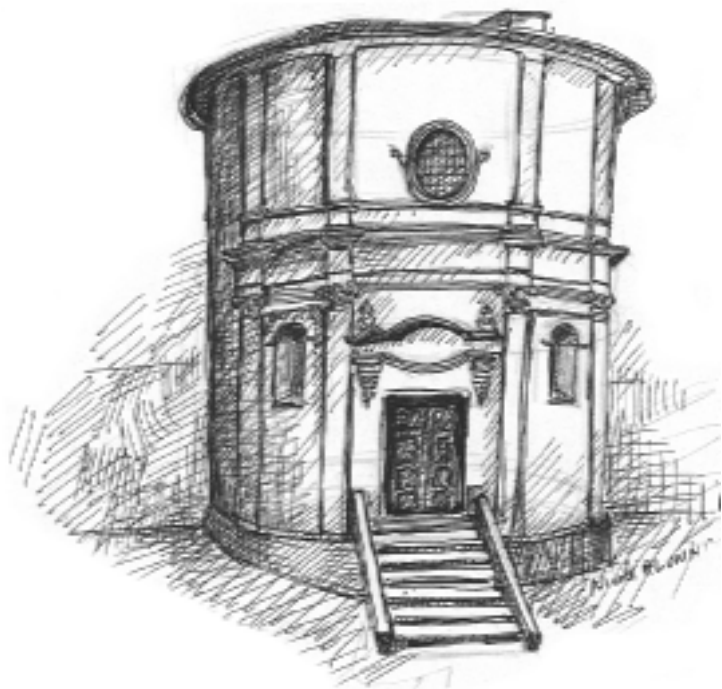
Chapelle des Pénitents Blancs d'en Haut à La Brigue

Ces deux confréries sont désignées comme étant les Blancs d'en haut pour l'Annonciade et les Blancs d'en bas pour l'Assomption, position qu'occupent leurs chapelles par rapport à l'église paroissiale.