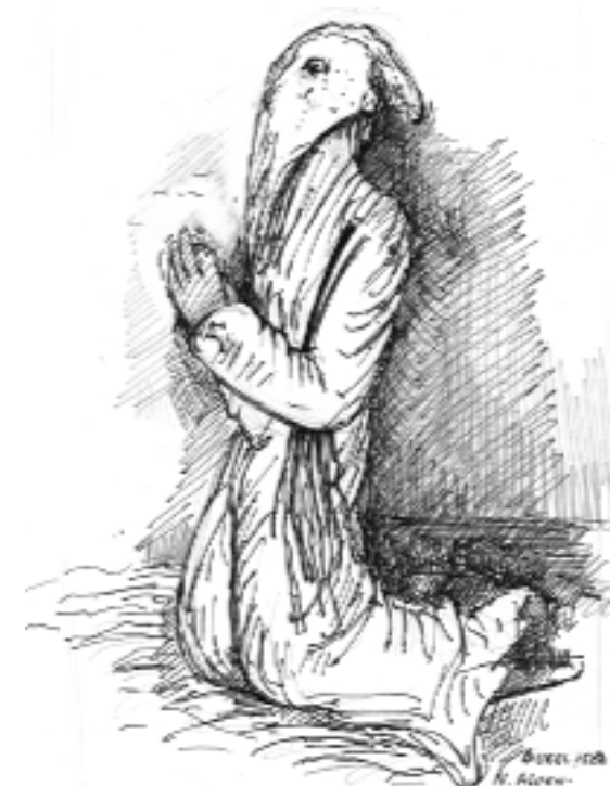
D'après un dessin de BUREL - 1584 (sous son bras, nous apercevons sa discipline)

Elle représentait aussi pour le pénitent une marque de fraternité puisque pouvait se côtoyer, sous le même habit et le nom de frère, un gouverneur de Provence et un ouvrier illettré.