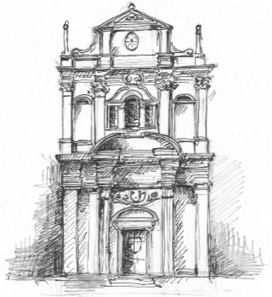
Chapelle des Pénitents Noirs de la Miséricorde à Breil sur Roya

Au XVII ème siècle, le village prend un grand essor.