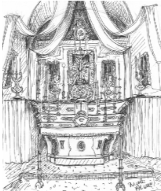
Intérieur de la chapelle des Pénitents Noirs de la Miséricorde à Tende (drapés d'apparat rouges et ors)

• La chapelle de la Miséricorde de la confrérie des Pénitents Noirs présente une façade austère qui contraste avec la décoration très chargée de l'intérieur.