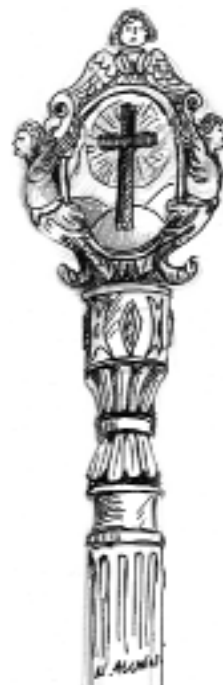
Bâton de prieur

L'importance architecturale et la richesse du décor d'une chapelle était le reflet de