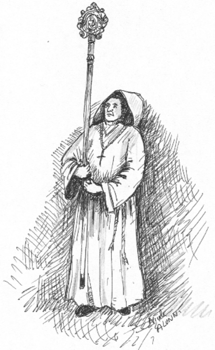
Pénitent en procession

Remerciements à GNECH Roger du « Cercle d'Etudes du Patrimoine et de l'Histoire de Sospel ».