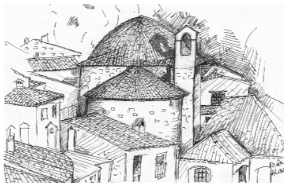
Chapelle des Pénitents Noir de Saint Sébastien à Peille

Au XVIII ème siècle le village comptait deux confréries, les Noirs et les Blancs. Les pénitents noirs ont occupés deux oratoires différents.