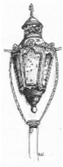
Fanal de procession