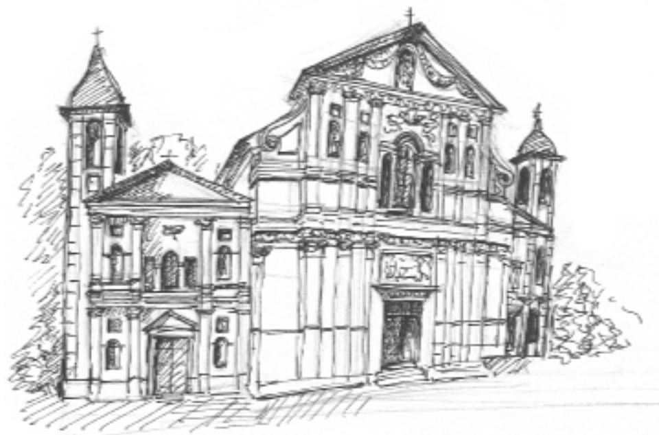
Eglise Saint Pierre aux Liens à L'Escarène flanquée des deux chapelles de Pénitents Blancs et Noirs

En 1646, la prospérité de L'Escarène permet la construction de l'église paroissiale Saint Pierre aux Liens.