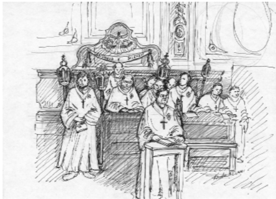
Pénitents Blancs de la Sainte Croix de Sospel dans leur chapelle

Les buts principaux des confréries étaient de rassembler les catholiques afin de pratiquer et développer la prière, faire pénitence et charité sous toutes ses formes : l'assistance aux malades, l'enterrement des indigents et l'ensevelissement des morts surtout en période de peste. Dans leurs statuts apparaissaient des exigences morales telles que l'entraide envers les confrères malades, pauvres ou défunts (funérailles).