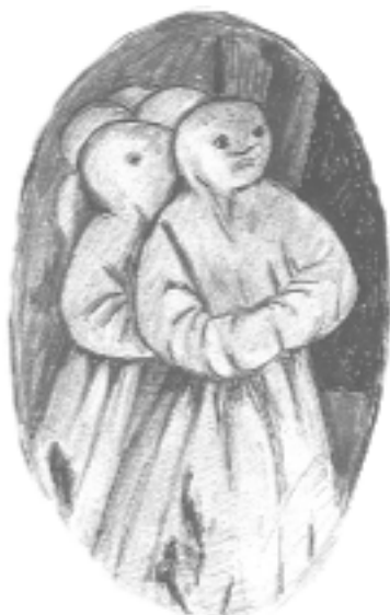
Détail du retable de la Piéta à la Cathédrale Saint Michel à Sospel où figure la plus ancienne représentation des pénitents du Comté.

Ces actes de dévotions prennent la forme de tableaux, de retables souvent riches et monumentaux. Ils sont le témoignage des moyens financiers dont la confrérie dispose. Dans certains tableaux apparaissent les pénitents en cagoule, nous renseignant ainsi sur les variations de détail du costume de chaque confrérie.