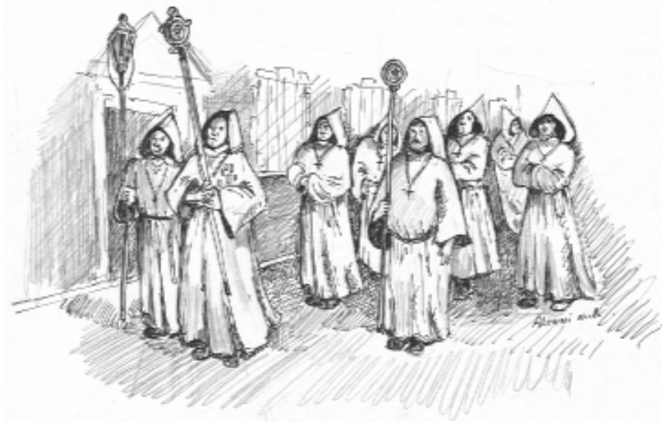
Les Pénitents Rouges de Nice en procession

pouvait exister une ou plusieurs confréries (par exemple : cinq à Sospel et sept à Nice). Elles font alors construire leurs chapelles ou rhabillent de style baroque celles déjà existantes.