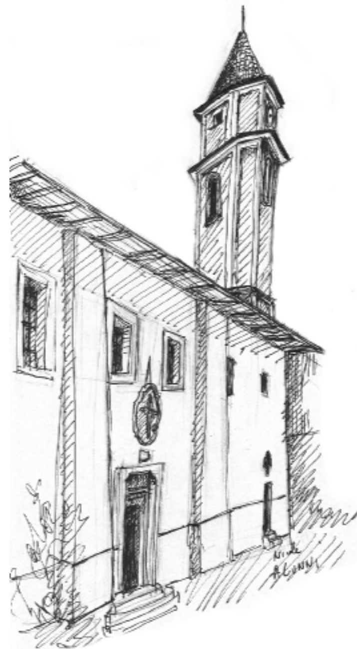
Chapelle des Pénitents Blancs Sainte Croix à Sospel (clocher triangulaire)

• Les Pénitents Rouges de la Sainte Trinité ont été créés au XVI ème siècle. Ils ont construit leur chapelle accolée à la cathédrale Saint Michel. Leur présence était encore